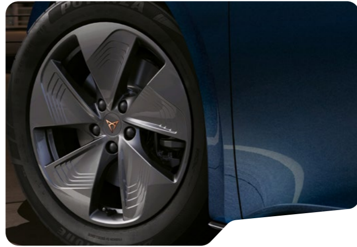
→ 48 CM (19") COPPER TYPHOON O