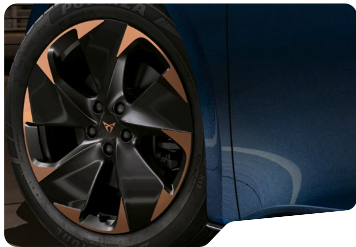
→ 48 CM (19") TYPHOON O