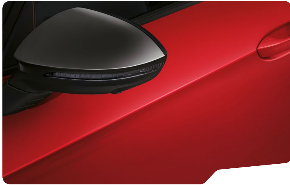
↓ ROJO RAYLEIGH