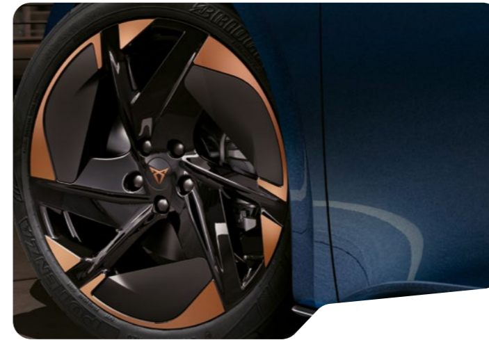
→ 51 CM (20") BLIZZARD O