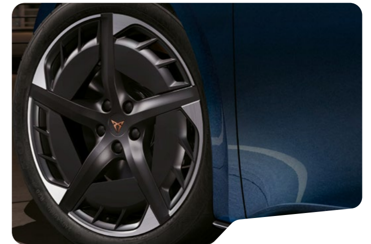
→ 51 CM (20") HURRICANE O