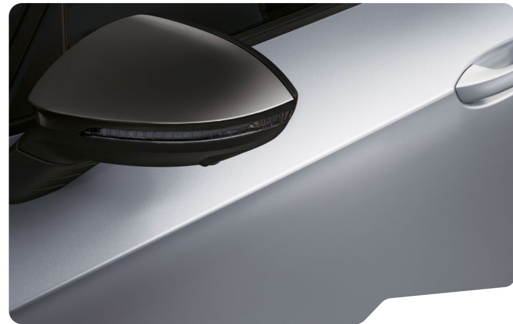
↓ BLANCO NEVADA