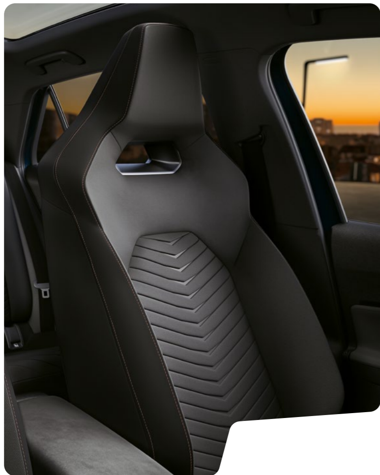
← ASIENTOS SEAQUAL® S