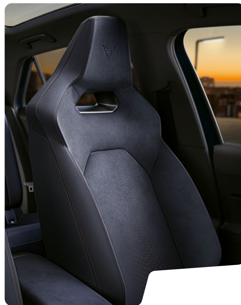
→ ASIENTOS DINAMICA® AZUL O